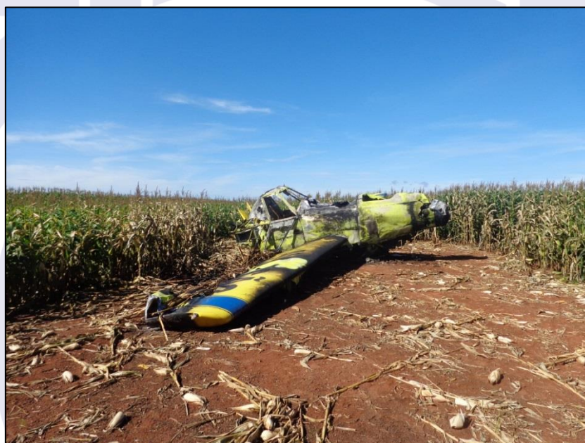
Figura 1 - Aeronave no local do acidente.

Houve danos a terceiros (plantação de milho).