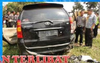
KENDARAAN TERLIBAT LAKA LANTAS