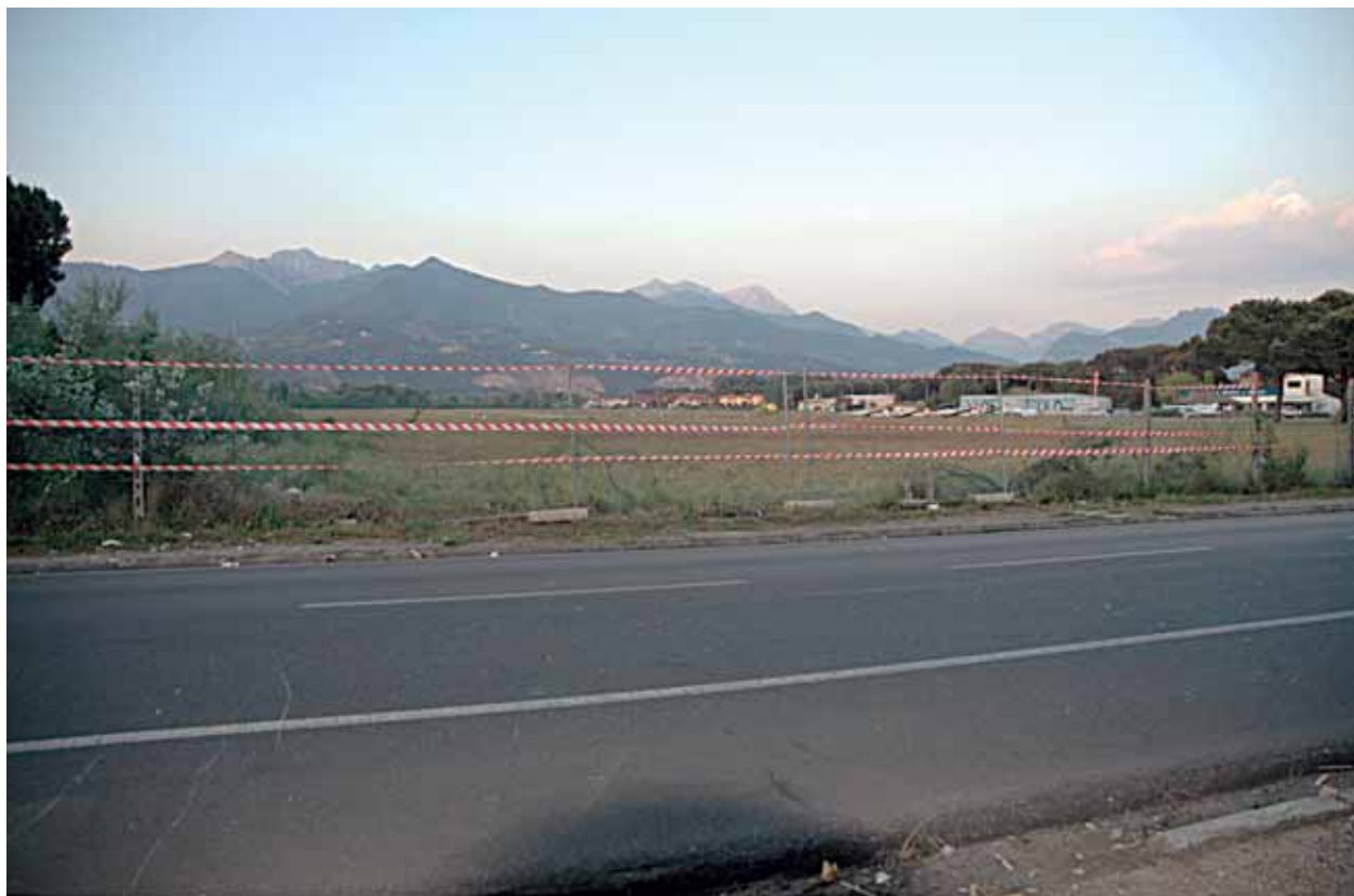
Lato Sud-Ovest della recinzione - tratto divelto dal motoaliante OE-9260.