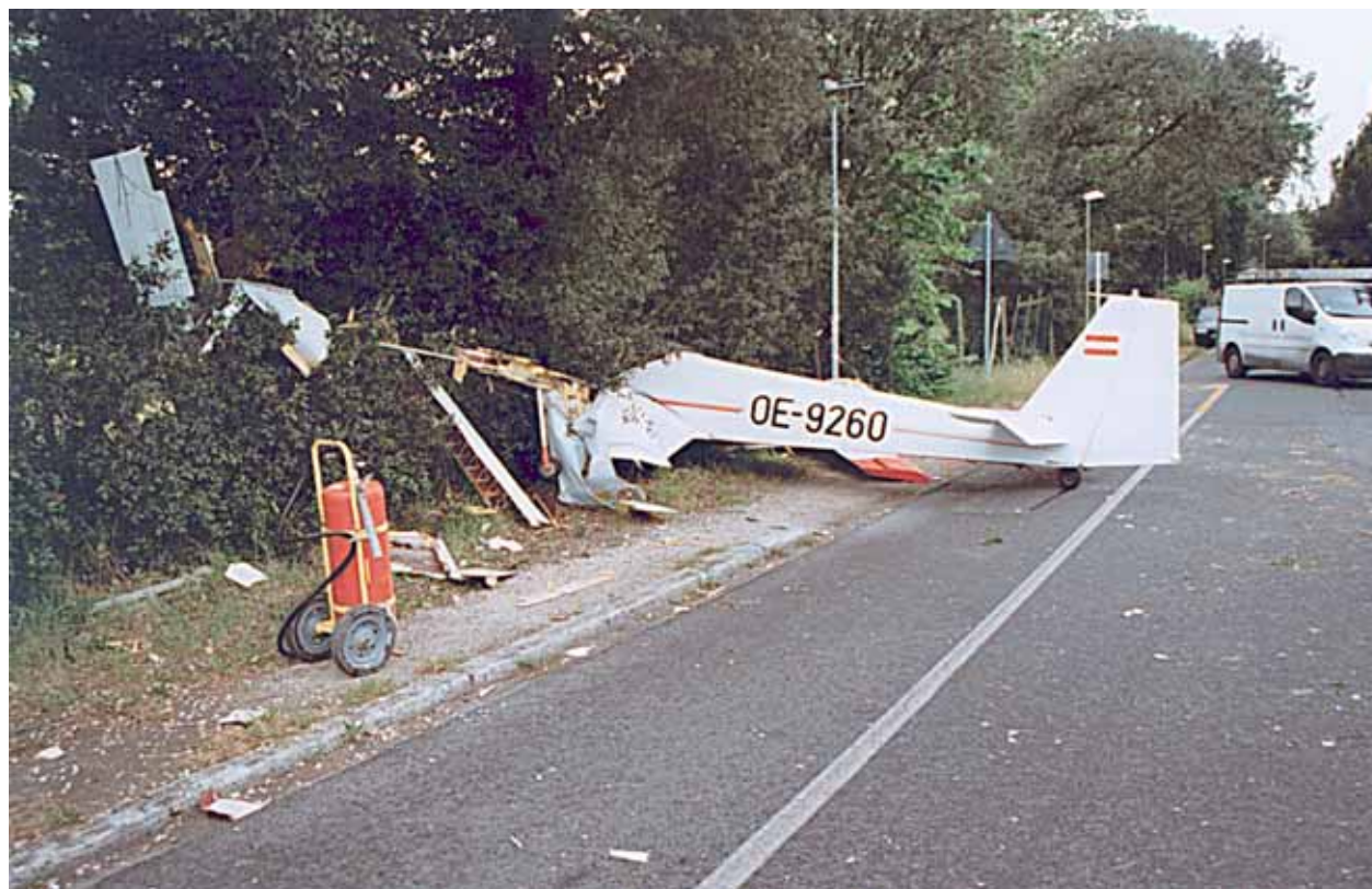
Punto di arresto del motoaliante.