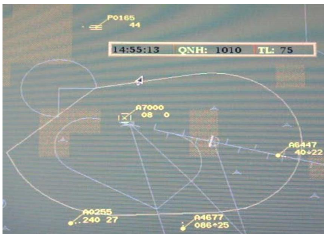
Figura 4: presentazione sugli schermi radar.