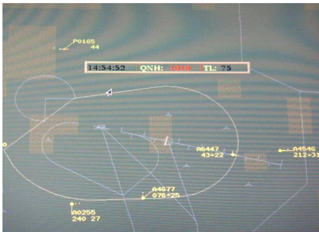
Figura 3: presentazione sugli schermi radar.