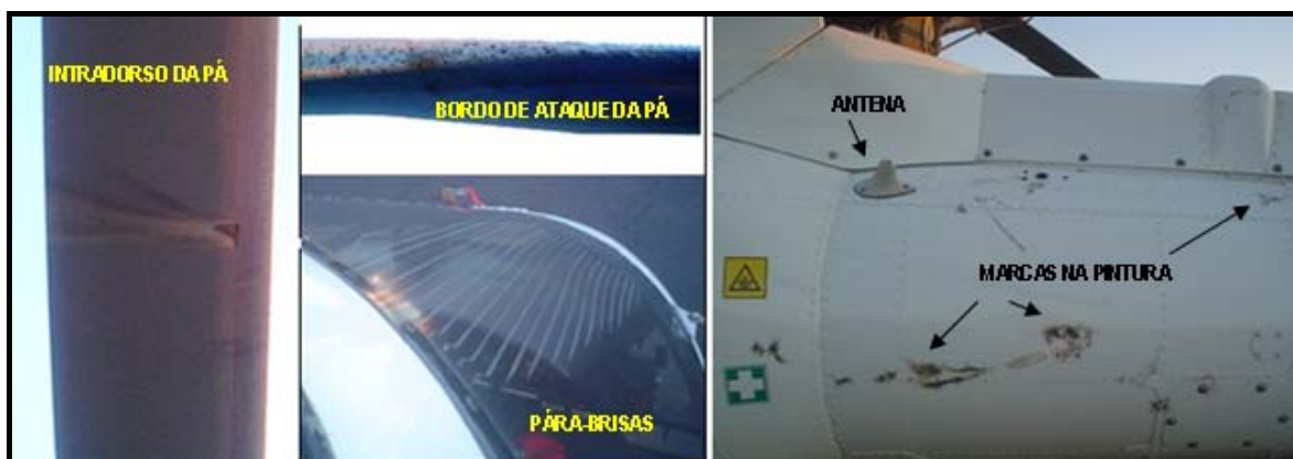
Figura Nº 2

A referida descarga atingiu e danificou uma das pás do rotor principal, o pára-brisas do lado direito, uma antena de comunicações e o lado esquerdo da fuselagem ( figura 2 ).