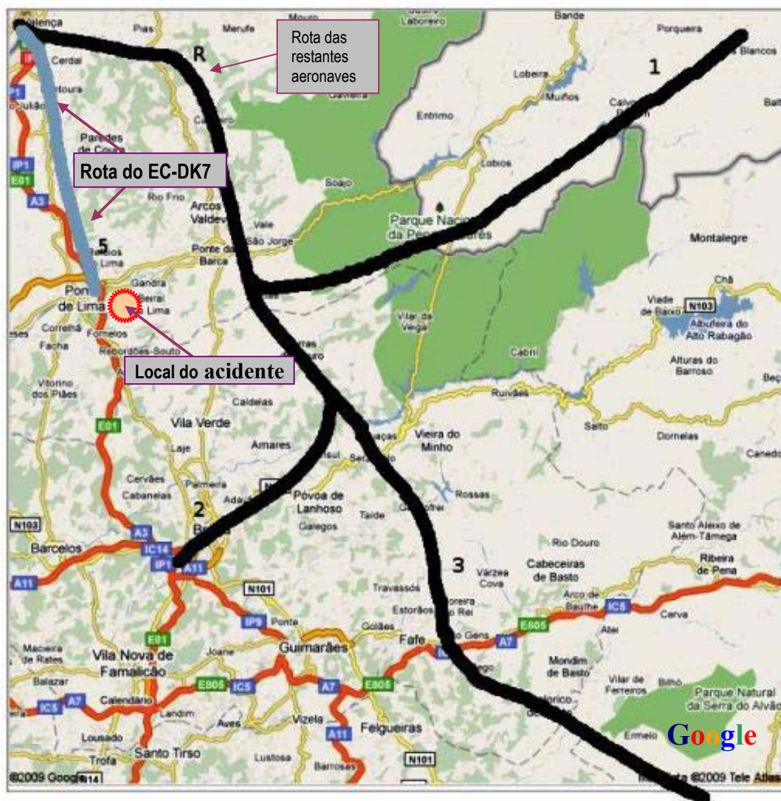
Figura nº 1. Rotas previstas (a preto).

Pouco tempo decorrido, aqueles pilotos perderam o contacto com o EC-DK7 e, não obstante as sucessivas chamadas que fizeram, nunca mais o conseguiram restabelecer.