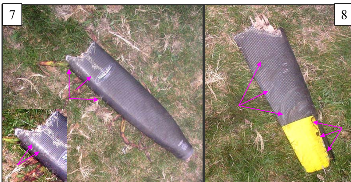
Figuras 7 & 8. Pás do hélice com marcas de movimento.

As pás do hélice apresentavam-se fracturadas e com marcas de movimentos.