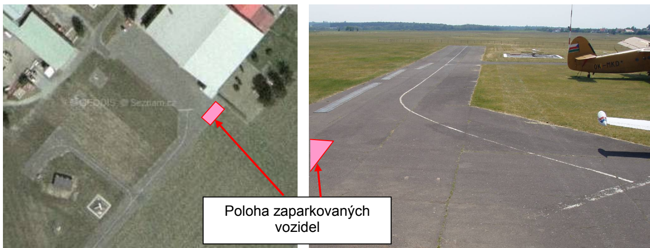
Uspořádání odbavovací plochy na letišti Mladá Boleslav

Vizuální prostředky a značení na odbavovací ploše pro bezpečnost provozu letadel a pohybu vozidel a osob na odbavovací ploše před hangárem nejsou použity. V místě události, na napojení asfaltové cesty v rohu odbavovací plochy, je viditelný zbytek bílé plné čáry.