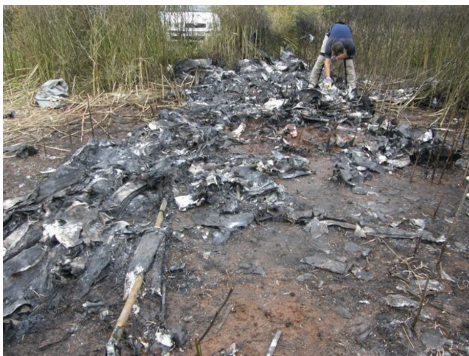
Místo letecké nehody.

Nárazem na zem a následným požárem byl ULLa zcela zničen.