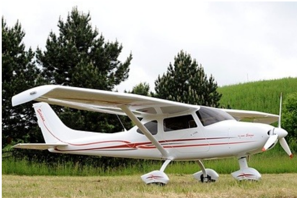
ULLa typu TL-3000 „Sirius“

ULLa typu TL-3000 „Sirius“ je dvoumístný vzpěrový hornoplošník klasické koncepce s tříkolým podvozkem předového typu. Celý je postaven z kompozitních materiálů.