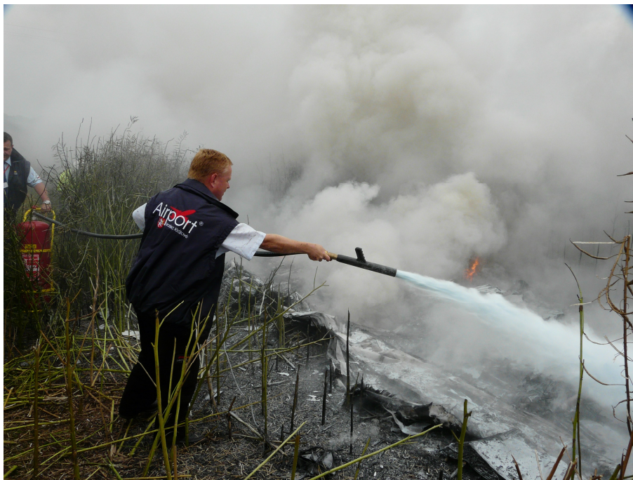
Hašení požáru pracovníky společnosti „Letecké služby Hradec Králové, a.s.“

Po nárazu ULLa na zem vznikl požár, který byl uhašen pracovníky společnosti „Letecké služby Hradec Králové, a.s.“, které přivolali svědkové letecké nehody.