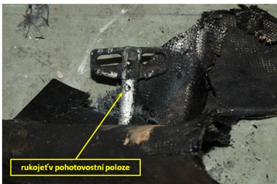
Rukojeť aktivačního mechanismu padákového záchranného systému.

Ihned po nárazu ULLa na zem vznikl požár iniciovaný palivem z roztržených nádrží.