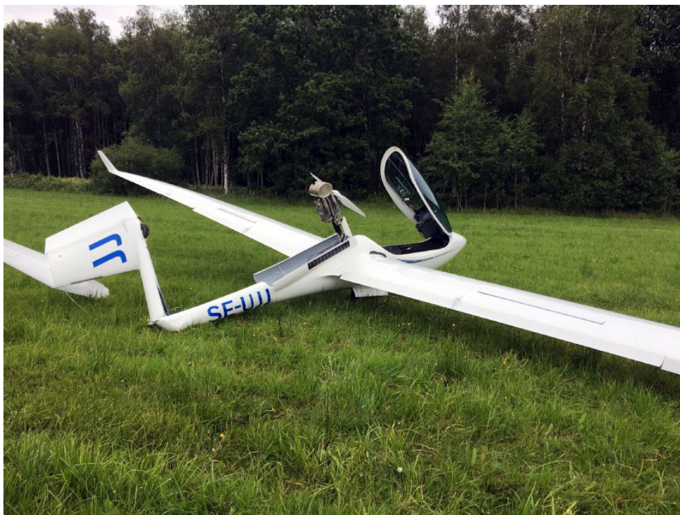
Figur 2. SE-UJJ efter olyckan med motor utfälld.