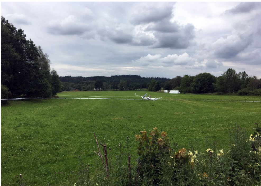
Figur 1. Segelflygplanet SE-UJJ sett mot inflygningsriktningen.

Vid landningen uppstod en studs. Under utrullningen insåg piloten att fältet, som slutade med en vägbank, inte skulle räcka och lade ner vänstervingen för att göra en s.k. groundloop 6 . När rotationen upphörde slog bakkroppen i marken och bröts av. Piloten, som var oskadd, kunde själv ta sig ur segelflygplanet.